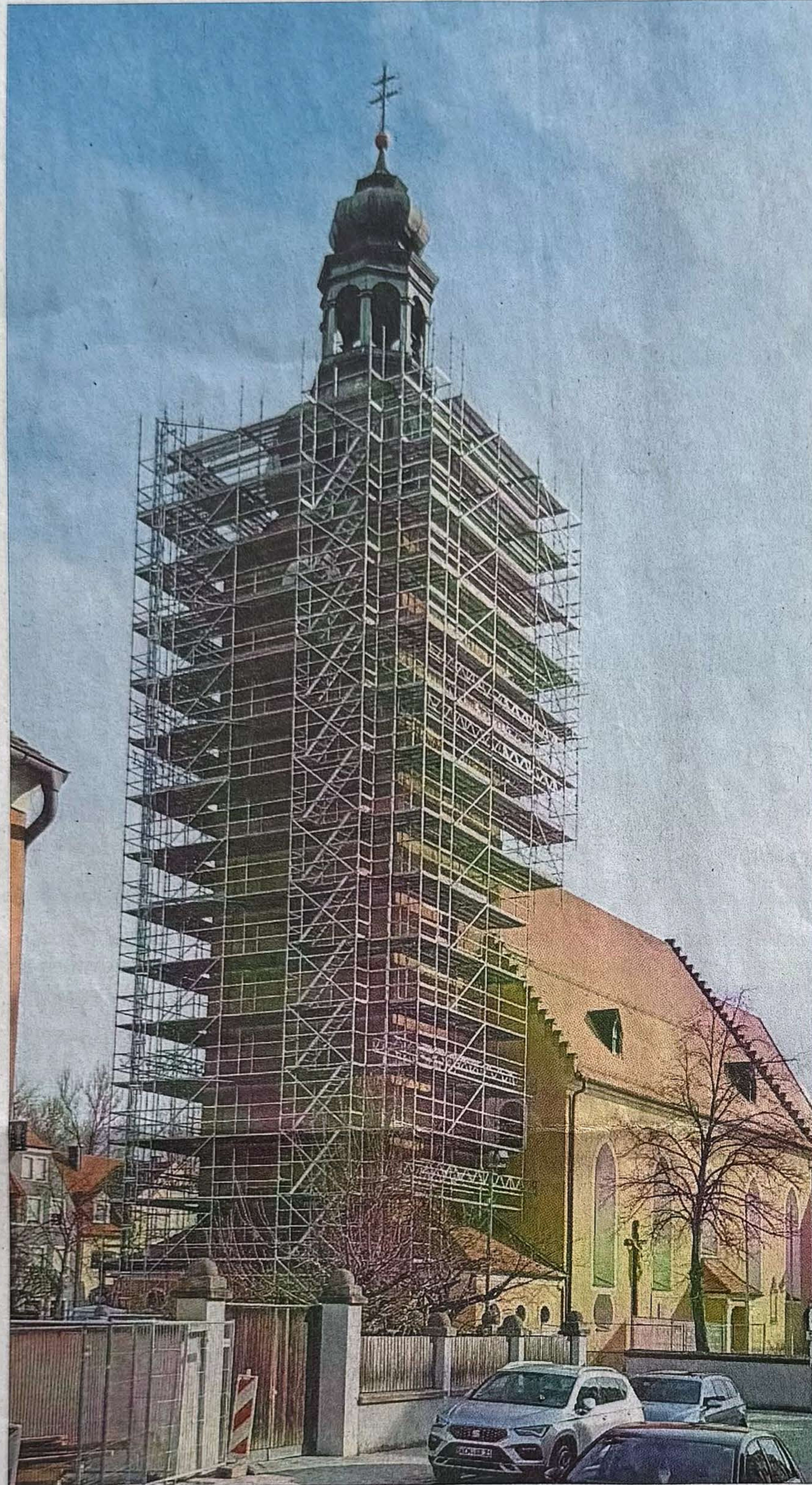
Der Turm der Stadtpfarrkirche Mariä Himmelfahrt ist rundum eingerüstet. Das Gerüst wird noch über das Turmkreuz hinaus erhöht. Die Sanierung soll im Oktober dieses Jahres abgeschlossen sein.

An den Treppen zur Glockenstube und zum Turmhelm werden Absturzsicherungen eingebaut beziehungsweise erhöht, ebenso die Handläufe an der Treppe zum Turm und Dachboden. Die Fassade wird abgewaschen. Die sanierten Mauer- risse werden außen mit Steinersatzmörtel ausgebessert, lockere Bereiche ergänzt, die Verfüguung des