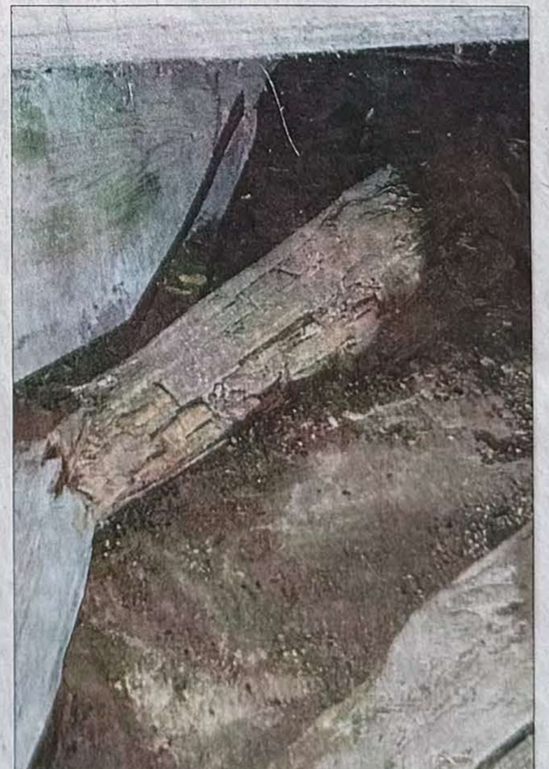
Auch hier zeigen sich die enormen Schäden an den Balken und Brettern im Kirchturm. Eine Sanierung ist dringend erforderlich.